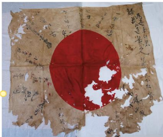
写真1 返還された日章旗(安曇野市豊科郷土博物館蔵)