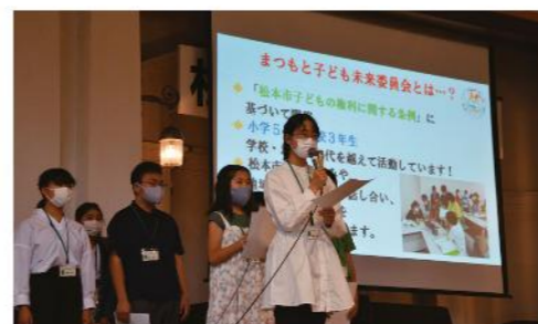
写真8 「まつもと子ども未来委員会」の発表

労働力の不足を補うため、当時植民地であった朝鮮半島から多くの人々が連れてこられました。県内では、長野市松代の地下壕(「松代大本営」)、松本市の陸軍松本飛行場、里山辺地下工場等の工事、農地開拓などで、苦しい作業に従事し、その方々に耐え難い苦しみと悲しみを与えてしまいました。