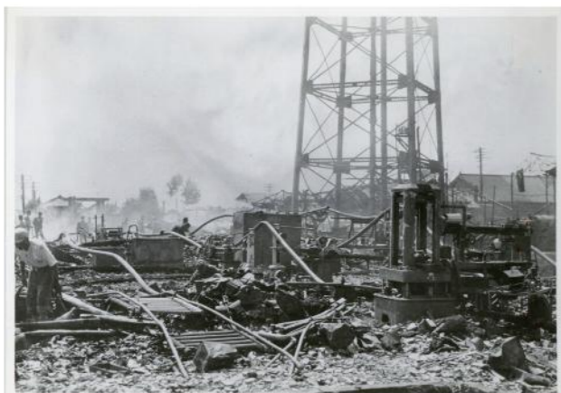
写真2 空襲で破壊された長野機関区 (「爆撃された長野機関区」長野県政史資料(写真集)19・事件・戦争・社会運動 長野県立歴史館蔵)