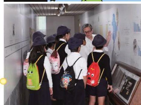
写真5 「満蒙開拓平和記念館」(阿智村)学校見学の様子