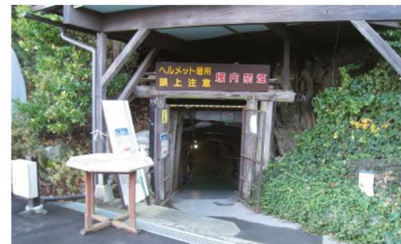
写真7 松代地下壕入口

国は、満州移民を進めるため、満14才から18才の青少年を募集し、開拓団に送り込みました。全国から10万人余、長野県からは全国最大の6万5千人が渡りました。戦争末期には、現地で兵士となり、多くの犠牲者を出しました。また、満蒙開拓義勇軍や独身開拓者の花嫁とするための訓練施設である「桔梗ヶ原女子拓務訓練所」(塩尻市)が設置されました。