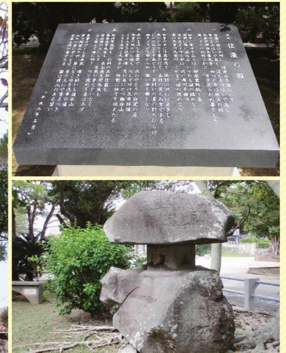
【建立年月日】 1964年4月6日 【石碑の大きさなど】 高さ330cm / 幅300cm / 重さ11,285kg