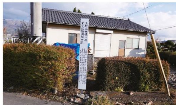
写真6 「桔梗ヶ原女子拓務訓練所」跡