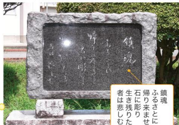
写真3 慰霊碑(伊那弥生ヶ丘高校)

終戦(8月15日)の2日前、午前7時頃。現在の東長野病院、長野駅、長野機関区、信濃川田駅跡、長野飛行場があった長野市大豆島、川合新田、松代町、篠ノ井駅などが、米軍艦載機により空襲を受けました。犠牲者は47名にのぼります。松岡神社(長野市松岡)の近くでは、防空壕が押しつぶされ、6才と9才の女の子、12才の姉に背負われた2才の男の子が犠牲となりました。県内では、同じ日に上田市、終戦の日には上田市、長和町が空襲を受けました。