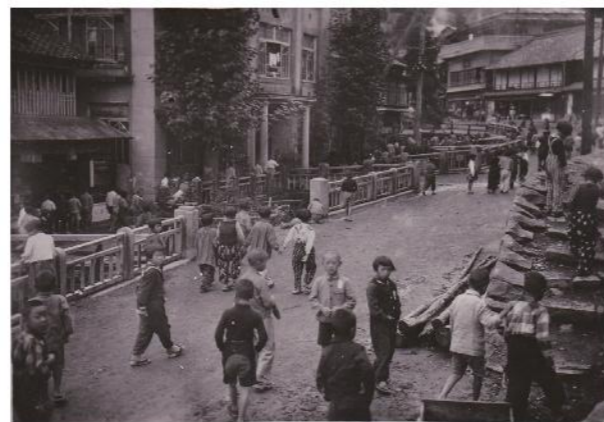
写真4 別所温泉を散策する疎開の子